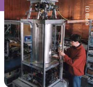
In der Physikalisch-Technischen Bundesanstalt in Braunschweig tickt die Atomuhr. Auch andere spannende Exponate aus der Welt der Wissenschaft können bestaunt werden.

Uhren entfernen kann. An alten Standuhren kann man wunderbar sehen, dass dort Pendel als Taktgeber eingesetzt wurden. Später wurden Quarzuhren genutzt, bei denen Schwingquarz der Taktgeber ist. Alles zu ungenau, befanden die Wissenschaftler. Im Jahr 1945 begann der US-Physiker Isidor Rabi mit der Entwicklung einer Atomuhr, bei der Ammoniak-Moleküle als Schwingungsgeber eingesetzt wurden. Heute sorgen Cesium-Atome für einen gleichmäßigen Takt. Wenn diese Atome von einem Energiezustand in den anderen wechseln, senden sie elektromagnetische Wellen aus, die als Taktgeber bestens geeignet sind, da sie fast zehn Milliarden Mal in der Sekunde schwingen.