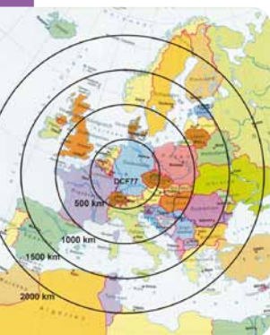
Die Grafik zeigt die Reichweite der Atomuhr in Braunschweig.

Wer jetzt sofort checken möchte, welche seiner Uhren im Haushalt die korrekte Zeit liefert, kann auf die Website https://uhr.ptb.de gehen – da tickt beständig eine Uhr mit Sekundenzeiger. Ihr Name: PTB-Uhr, wobei PTB für Physikalisch-Technische Bundesanstalt steht. Dort, in der Bundesallee 100 in Braunschweig, tickt eine der exaktesten Uhren der Welt, die landläufig „Atomuhren“ genannt werden. Sie sind der unverrückbare Maßstab, wenn Rechner lokaler Netze oder das Internet ihre Zeit synchronisieren möchten. Während eine batteriebetriebene Armbanduhr mit der Zeit gerne langsamer wird und hinterherhinkt, weisen Atomuhren nahezu keine Abweichungen auf. Es müssten eine Million Jahre vergehen, bis man einer Atomuhr eine Abweichung von nur einer Sekunde nachweisen könnte. Damit sind sie so exakt, dass sich Funkuhren, industrielle Steuereinheiten und auch die im Fernsehen geltenden Zeiten nach ihnen richten.